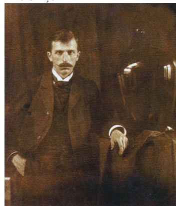
Vilhelms Purvītis. Fotoportrets. Ap 1900. (1872.3.III—1945.14.I) Latvijas mākslas ekspertu un plašākās sabiedrības aprindās atzīts par vienu no ievērojamākiem Latvijas 19. gs. beigu, 20. gs. pirmās puses māksliniekiem un mākslas institūciju veidotājiem.