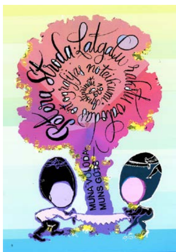
Pēteris Gleizdāns "Muna volūda, muns gūds"