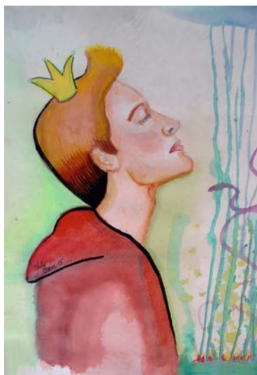
Zīmējumi uz burtnīcu malām