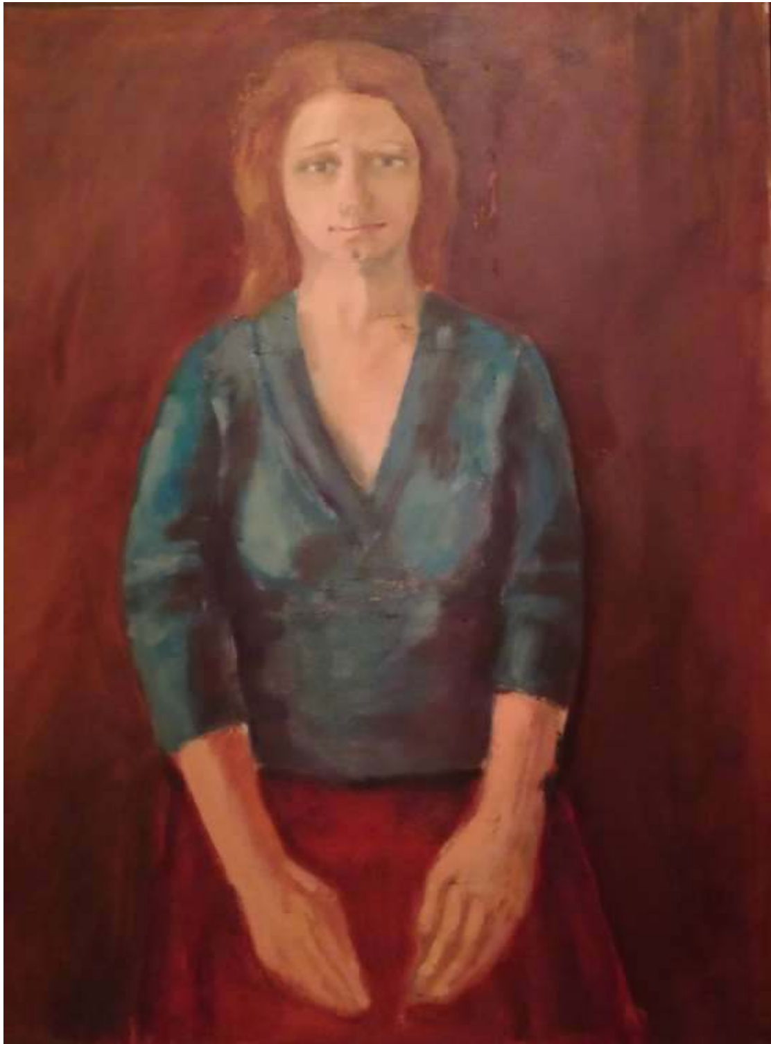
1. RMDV audzēknes gleznojums, Bez nosaukuma (autora vārds zudis)

Šeit var gūt priekšstatu, kā darbs risināts pretskatā. Šajā darbā ir vērojama sarkano krāsu saskaņotība. Veiksmīgi izvēlēts miesas krāsas tonis, padarot darbu “vieglu”.