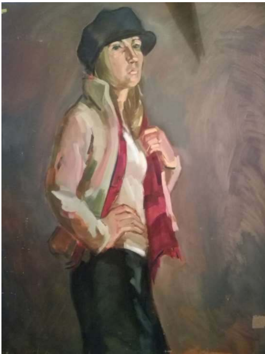
3.A. Laicāne Bez nosaukuma, k/e 2006 RMDV audzēknes gleznojums

Šajā darbā var gūt priekšstatu, ka ar lieliem un drošiem triepieniem atrisināts darbs. Uz apgērba var izsekot gaismas un ēnas dalījumu, kā arī veiksmīgi modulēta seja.