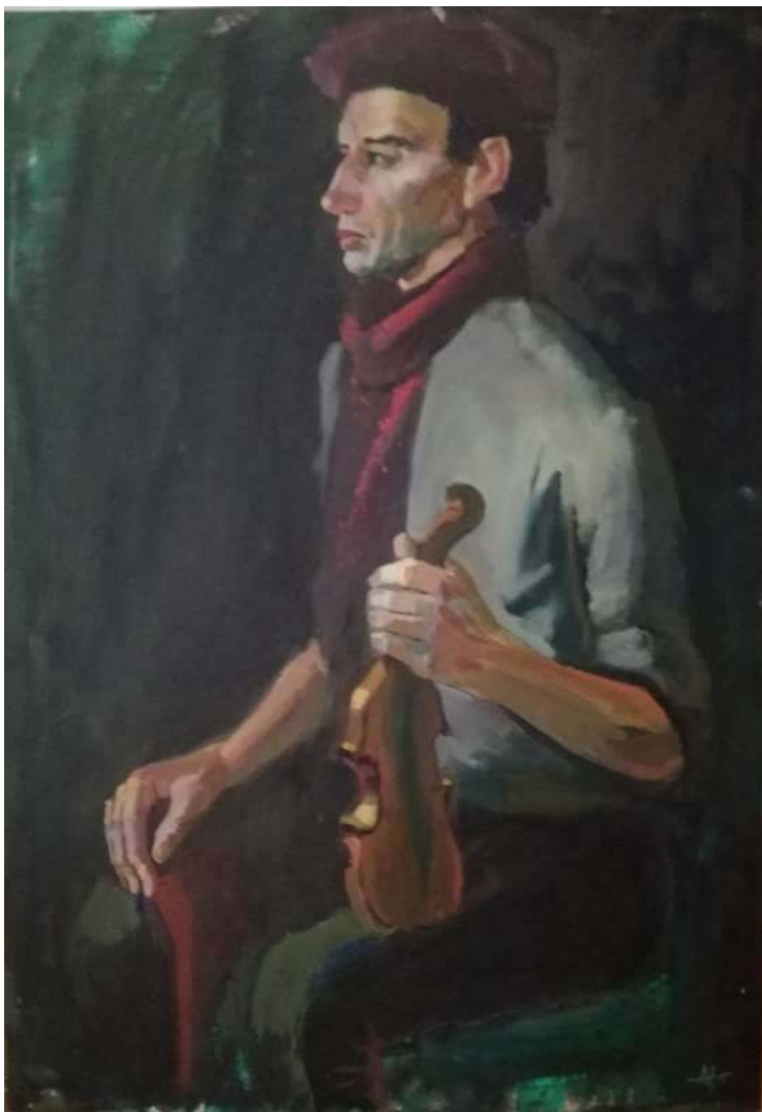
2.A. Pīzelis RMDV audzēkņa gleznojums

Šajā darbā var gūt priekšstatu, kā risināts darbs profilā.